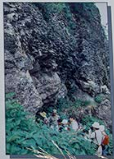
岩屋を構成する板状節理